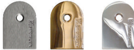
Nickel Satiné Laiton Poli Nickel poli