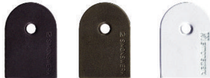
Ombre Rustique Bronze Métallique Peinture électrostatique