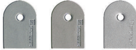
Allure Satin Chrome Allure Nickel Satiné Allure Acier Inoxidable (SSL)